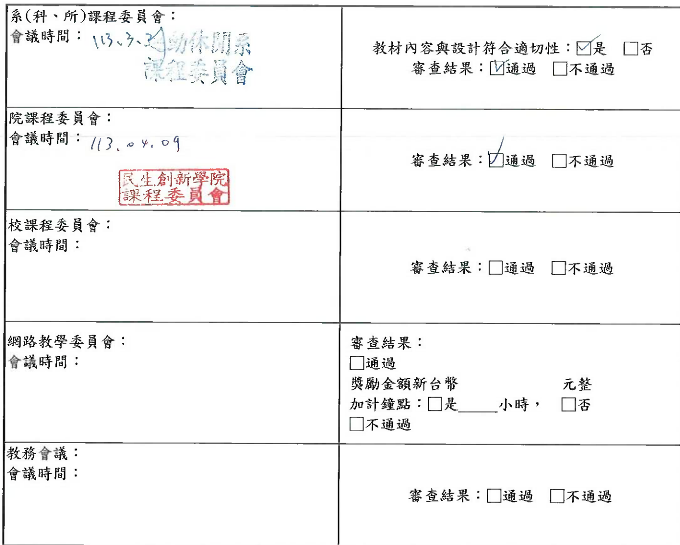
附表：大專校院遠距教學課程－教學計畫大綱