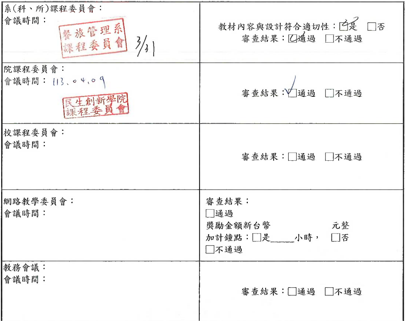
附表：大專校院遠距教學課程一教學計畫大綱