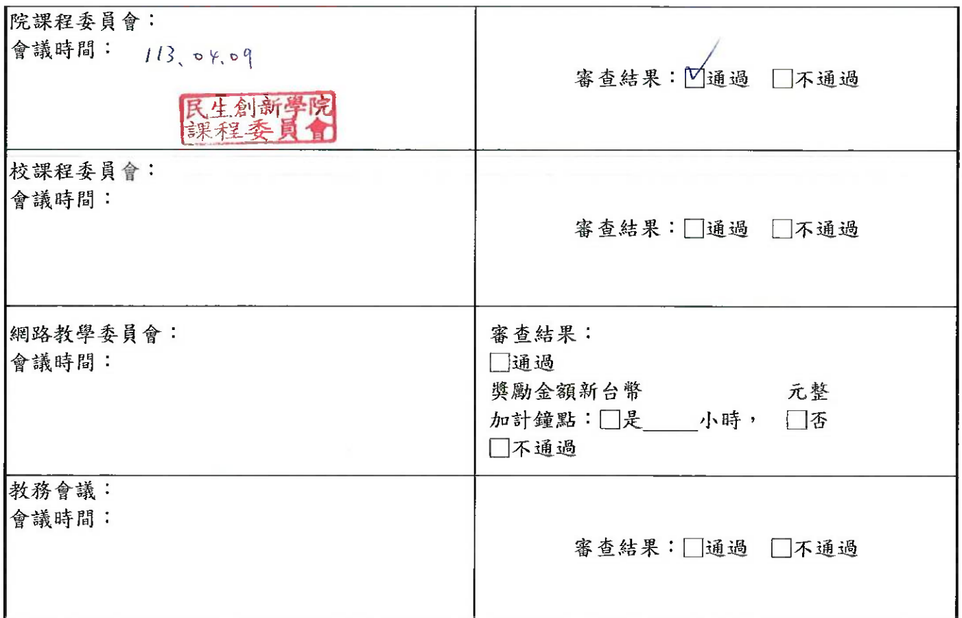
附表：大專校院遠距教學課程－教學計畫大綱